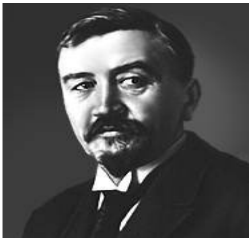
А. И. Куприн (1870- 1938)