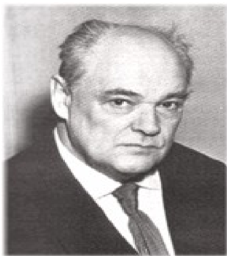
Е. И Чарушин (1873-1954)